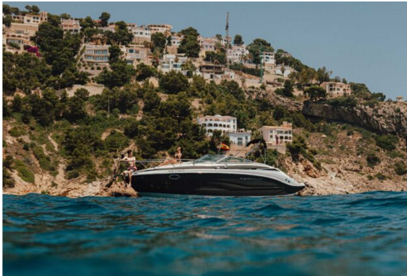
Llogar vaixell Dénia - Restaurant Nomada

Si et ve de gust llogar un dels seus vaixells pots trucar a l'662941887 i reservar o demanar més informació. I si vols provar els seus exquisits plats d'alta cuina italiana, pots reservar trucant a l'644 90 87 92.